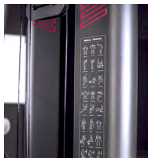
TABLA DE EJERCICIOS

Diferentes alturas de agarres para una adaptación mayor de cualquier usuario.